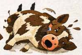
Effondrement & Mort Soudaine