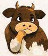
Arrêt de l'Alimentation