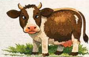
Flanc Gauche Gonflé