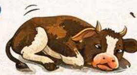
Agitation & Salivation